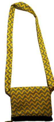
Tasche Line Bestellnr. 00214