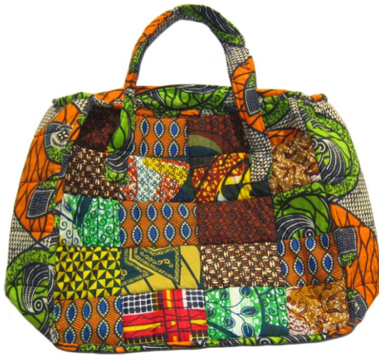
Patchwork-Tasche Inkuka in den Größen: klein, mittel, groß