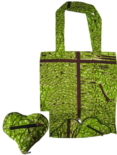
Herztasche Mutima ★★★