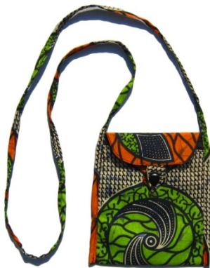
Tasche Intore Bestellnr. 00611