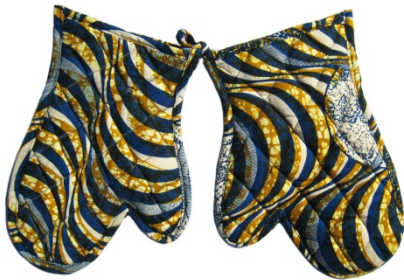
Topflappen Handschuh Bestellnr. 01711