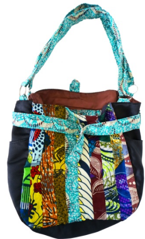
Sheja Designertasche ★★★ Bestellnr. 01313