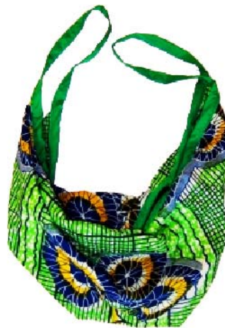
Tasche Kivusee Bestellnr. 001213