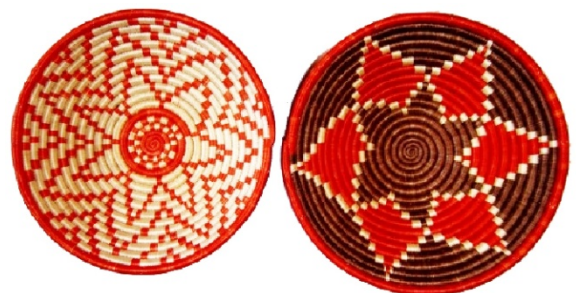
Körbe ★★★ Bestellnr. 03813