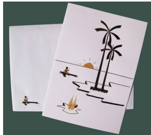
Postkarten ★★★ Bestellnr. 01511

Auf Anfrage werden in den Hilfsprojekten von Ruandahilfe e.V. Kleider verschiedenster Art angefertigt.