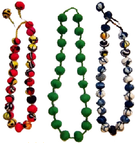
Ketten ★★★ Bestellnr. 02111

Ketten, Ohrringe und anderer Schmuck werden aus Lackperlen und Stoff, Postkarten (verschiedenste Motive) aus geklebten Bananenblättern hergestellt.