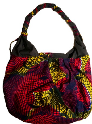
Tasche John Bestellnr. 00314