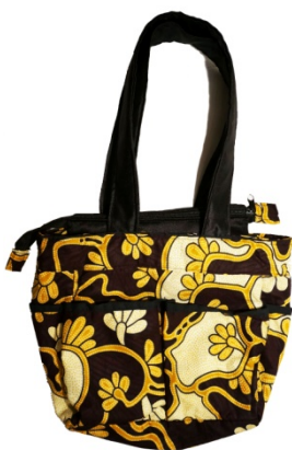
Tasche Iza Bestellnr. 00711