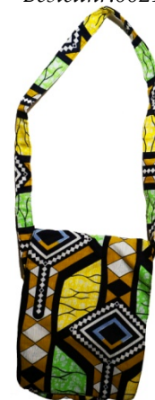
Tasche Maria Bestellnr. 00614