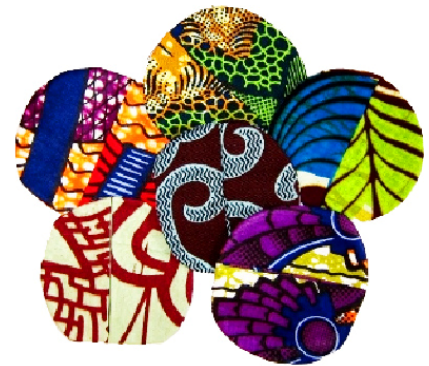
Untersetzer Bestellnr. 04013