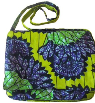
Laptoptasche mit Träger Bestellnr. 00916