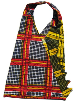
Tasche Gatatu Bestellnr. 00411