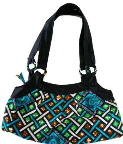
Partytasche ★★★ Bestellnr. 002613