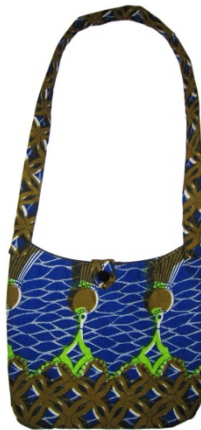
Tasche Amazi Bestellnr. 00311