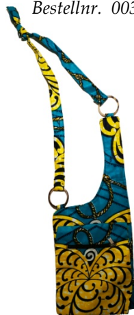
Tasche Rumba Bestellnr. 00114