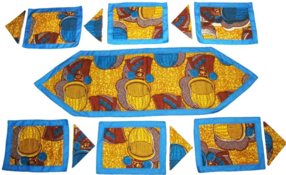
Tischläufer mit sechs Tischsets und Servietten Bestellnr. 02611