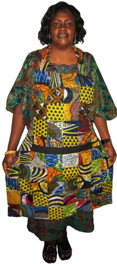
Schürze ★★★ Bestellnr. 00111