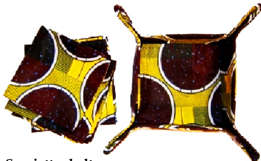
Serviettenhalter Bestellnr. 01213