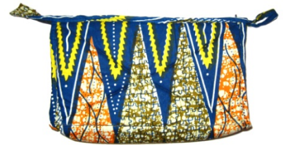
Kulturbeutel Bestellnr. 01411