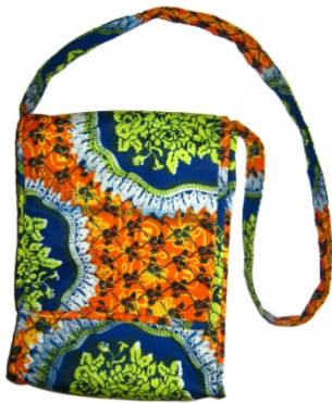
Tasche Ankole Bestellnr. 00211

Alle Produkte sind in verschiedenen Farben und Größen erhältlich. Produkte mit ★★★ sind bei unseren Kunden besonders beliebt.