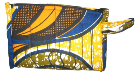
Allzweck- und Brillenetui