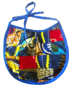
Lätzchen Bestellnr. 00913