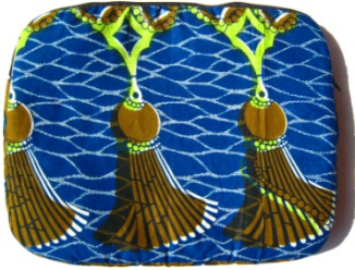
Laptop-Hülle Bestellnr. 01011

Laptopaschen sind in der Regel für die Größen 11", 13" und 15" auf Lager.