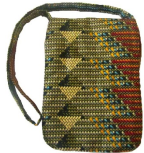
iPad-Tasche Bestellnr. 00915