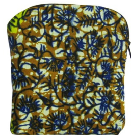
Geld- und iPod-Taschen