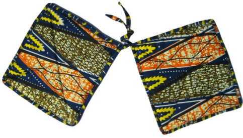
Topflappen standard Bestellnr. 01611