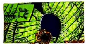
Clutch Bestellnr. 001113