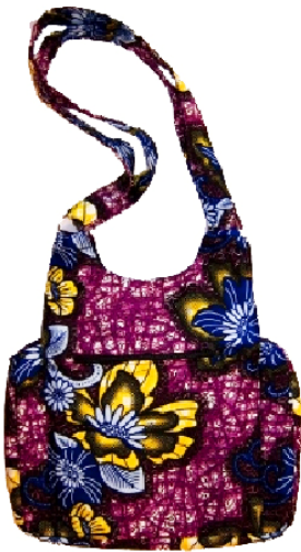
Laptoptasche spezial Bestellnr. 00213